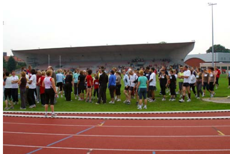
Enkele sfeerbeelden van de Start-to Run test 2007

De verwachte doorbraak van Sigrid Vanden Bempt kwam er in 2002 met een gouden medaille op de 3000m steeple. Het jaar nadien wist ze zelfs twee titels te behalen: 3000m steeple en 5000m. Sigrid won ook twee bronzen medailles tijdens de Europese beloftekampioenschappen: in 2001 te Amsterdam en in 2003 te Bydgoszcz. Net als Sandra Swennen in het hinkstap, werd Sigrid nationaal recordhoudster in de steeple.