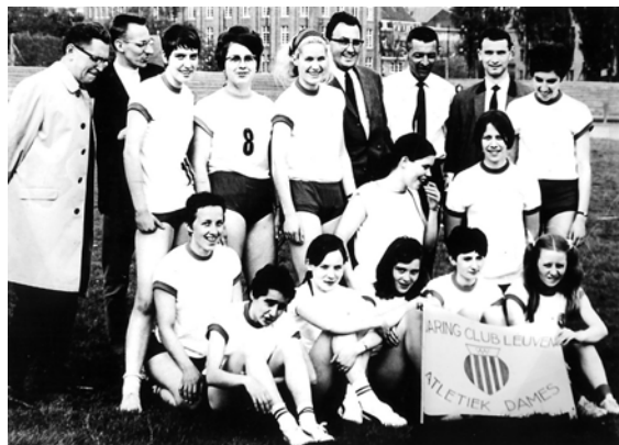
Interclubploeg van 1969

DCL kreeg de inrichting ervan toegewezen. Onder de waakzame ogen van de bondsleiders werd de allereerste "officiële" Belgische vrouwencross in het Stadspark van Leuven betwist op 3 februari 1968.