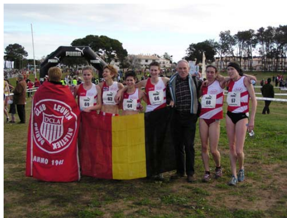
Onze vrouwenploeg aan de slag in Albufeira (Portugal 2008)

Het moet zijn dat onze vrouwen het wisten dat ze het vijftigste jaar met enige glans moesten oppoetsen. En hoe! Op 10 mei 2008, onder een warme Nijvelse zon, slaagden onze dames erin om voor de eerste keer in 50 jaar de KBAB-interclubbeker naar Leuven te halen. Een prestatie om U tegen te zeggen.